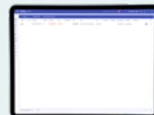
Vista elenco degli allarmi correnti