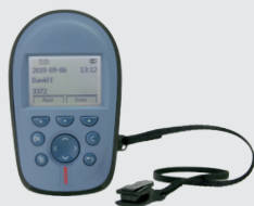
Cordon d'arrachement pour Ascom a51/a71 Référence 660275