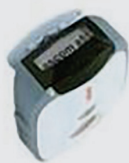
Étiquette de nom pour Ascom a51/a71/p71 Référence 660135 (a51) Référence 660160 (a71/p71)

Ascom (France) S.A. 48 rue Carnot 92156 Susresnes, France FR.Communication@ascom.com Téléphone : +33 1 47 69 64 64 www.ascom.com/fr