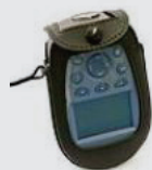
Étui en cuir avec clip pivotant pour Ascom a71/p71 Réf. 660157