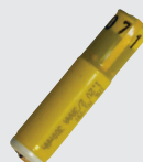
Batterie à induction IBP1B pour Ascom 914D/T Réf. 660355 (pas pour les pagés ATEX)