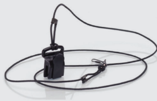
Cordon/Cordelette de sécurité en polyester pour Ascom 914D/T, a51/a71/p71 Référence 543218