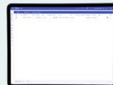
Liste des alarmes en cours