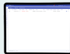
Listvy över aktuella larm