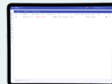
Listevisning af aktuelle alarmer