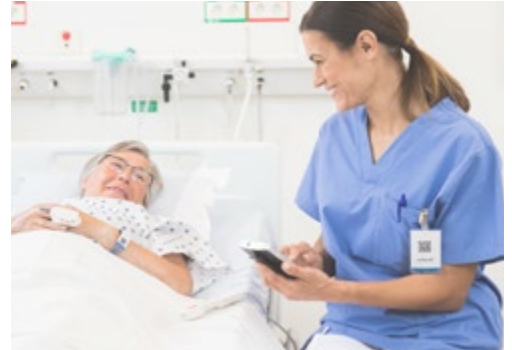
Zorg aan het bed: registratie van vitale parameters in het EMD/EPD terwijl u bij de patiënt kunt blijven.

Een Ascom Myco 3 oplossing maakt een breed spectrum van actuele klinische informatie beschikbaar.