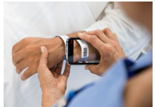
Barcode scannen: beveiligde verificatie van patiënt-ID's bij het toedienen van medicatie.