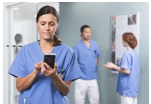
Hiermee hebben artsen onderweg inzage in laboratoriumuitslagen, afbeeldingen, verzoeken en alarmen die ze bovendien kunnen delen.