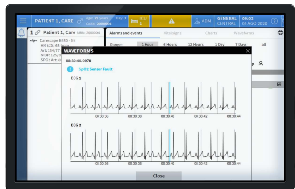
Smart Central live waveform weergave

De mogelijkheid om waveforms in near-realtime te bekijken wanneer zorgverleners niet in de buurt van de afdeling zijn, helpt om de patiëntenzorg te stroomlijnen. Wanneer coördinatie met collega's nodig is, kunnen zij de toestand van een patiënt evalueren en de beste handelsewijze bepalen. Het automatisch vastleggen en synchroniseren van momentopnamen van waveforms met events, helpt bij het creëren van context bij alarmen. Dit ondersteunt het werkproces voor alarmmanagement.