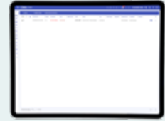
Lijstweergave van actuele alarmen